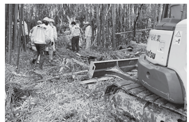
【長洲町赤田区】(令和2年度実施)