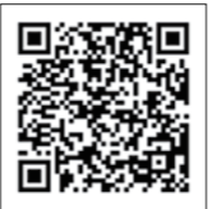
国税庁LINE公式アカウントから事前予約