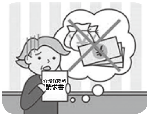
急がれる介護保険料の引下げ

答 (町長) 介護保険料を引下げることが出来るのが一番だと思う。介護保険運営協議会でしっかりと議論をしていただきたい。