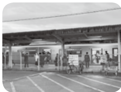
町外に進学する子どもに補助がないのは不公平では

問 教育委員会は、「ふるさとを愛し、夢をもって未来を切り拓くひとづくり」子どもを真ん中に「基本理念として取組んでいる。本町に住む子ども達全てが平等でなければならない。