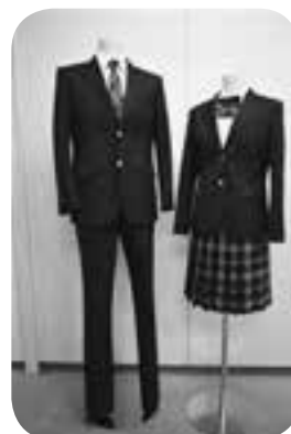
新長洲中学校の制服