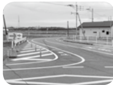
対応前(上)と対応後(下) 早々住民の声が活かされた