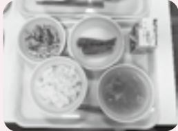
食育も担う学校給食

総工費28億6千万円余りで完成したセンターは最大6千食の調理能力があり、最新の衛生管理手法が採られ、ゾーン分け、衛生的な配慮やアレルギー対応食、災害時も3日間炊出し可能な設備等の特徴がある。 子ども達の笑顔を思い浮かべながら当日のメニューを食した。 アレルギーマッチの子どもが増えている現状への対応や県産食材の利用状況等の質問もあった。 物価高騰の中、メニューや食材を工夫し、アレルギーマッチ等安全な給食の提供に感謝し、持続的な運営に向けて期待している。