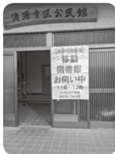
今日は移動図書館が来ますよ！

答 (生涯学習課長) 小説が最も多く、他には料理や園芸等、趣味に関する本が多く貸出されている。