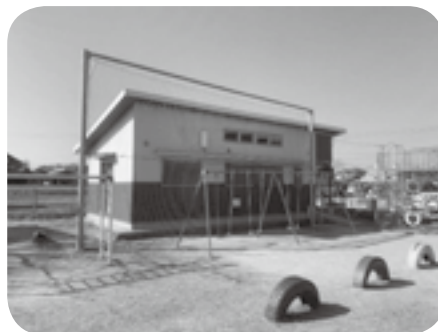
学童保育の定員拡充を

問 放課後子ども教室について、各小学校区で一体型放課後子ども教室協議会を設置しているが、協議会で出た課題や提案には前向きに取り組んでいるか。