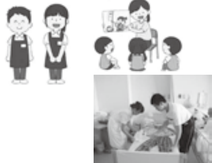
町内にも色々な職場があるんだな！