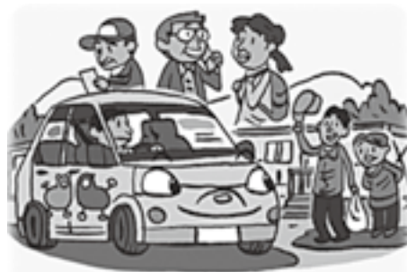
地域の支え合いで移動支援を (日本カーシェアリング協会参照)

問 令和4年度の実績は。 答 (町長) 先進的に取組んでいる自治体の事例等を調査し、地域での導入の意向等に注視していく。 問 運転免許証を自主返納した日から1年間有効の、きんぎょタクシーの無料乗車券発行件数の実績は。