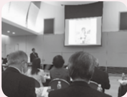
より良い議会だよりのために

今回は、「討論型クリニック」と称し、事前に議会だより「潮さい」を読んでいただき、会場の参加者からコメントをもらう方法で行われた。 潮さい第152号（令和4年2月発行）の感想を頁毎にいただき、正副委員長による返答方式で行われた。例えば、「裏表紙の文字が小さいので高齢者にも優しい大きなフォントにした方が良い。」等諸々の感想をいただいた。ここでのご意見・感想を今後に反映して、より良い議会だよりにしていきたい。