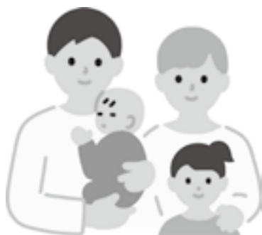
更なる子育て支援を

答 (町長) 国の動向をしっかりと見極めながら、今後、新しい事業を取組んでいきたいと考えている。