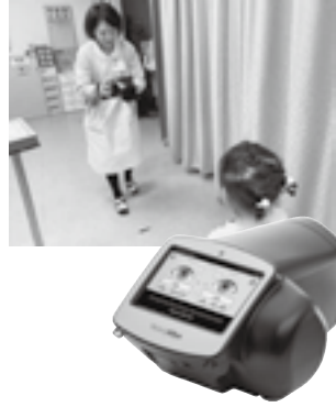
健診で視力異常を早期発見

答 (福祉保健介護課長) 3歳児健診時において視力異常を早期に発見、早期治療につながることで、就学時までの早い段階で視力を回復させることができる。