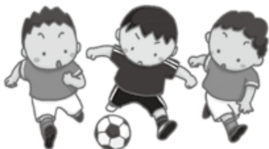
放課後活動の充実を

学 童保育について、今年の夏休みは、屋外も体育館も暑いため、空調の効いた建屋の中で過ごし、外に出る機会がなかったと聞いたが、状況は。