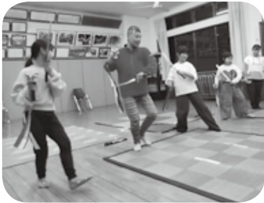
神楽の練習に励む子ども達