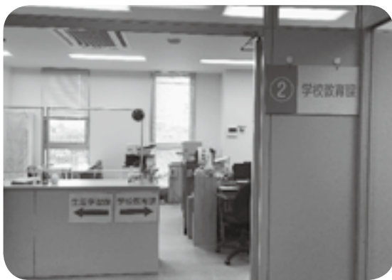
教育委員会は「矛盾する回答は していない」と繰り返している

問 当時中学1年生の女子生徒が 被害に遭った中学校の暴力事 件に伴う教育委員会の答弁で、自 ら発言しながら発言自体してい ない等と強硬に虚偽答弁した。これ