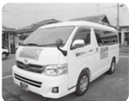
荒尾・玉名市方面へもドア・ツー・ドアの送迎を

公 公共交通機関の廃止や運転免許証自主返納で、日常生活に必要な移動手段を確保できない高齢者等の交通弱者への移動支援が求められていることから、町は地域公共交通計画の策定を進めているが、交通弱者の移動手段を確保するために、どう取組んでいるか。 答 (町長) 計画策定では、公共交通に関する町民アンケートを始め、きんぎょタクシー利用者に対するアンケート等を実施し、町民の公共交通に対する声を聴いている。きんぎょタクシーは町民に定着しており、継続運行に努めていく。