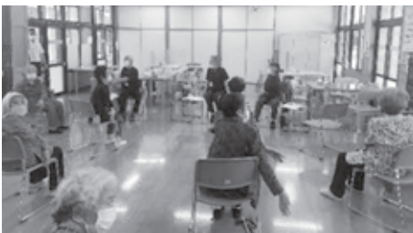
〈げんきの館での体操実践の様子(13期生)〉

今後20人の元気あっぷリーダーは、本講座で学ばれた「介護予防の知識」を生かしながら、先輩のリーダー達とともに「元気あっぷ体操(くまもとホクホク体操)」を指導されます。