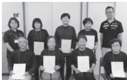
〈元気あっぷリーダー14期生の皆さん〉

「元気あっぷ体操教室」は、運動習慣を無理なく身につけて健康寿命を延ばし、元気あっぷリーダーと地域の皆さんと一緒に参加することで、地域での支え合いの輪を広げていくことを目的としています。「元気あっぷ体操教室」は、26か所まで増えています！ 肩痛・腰痛・膝痛の予防・軽減効果が期待できます。体操時間は1時間程度です。お気軽にご参加ください♪