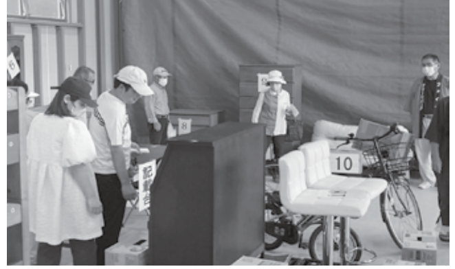
リサイクル品抽選会の入札中の様子