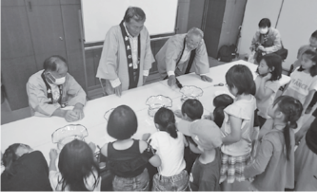
金魚についての説明を真剣に聞く子どもたち