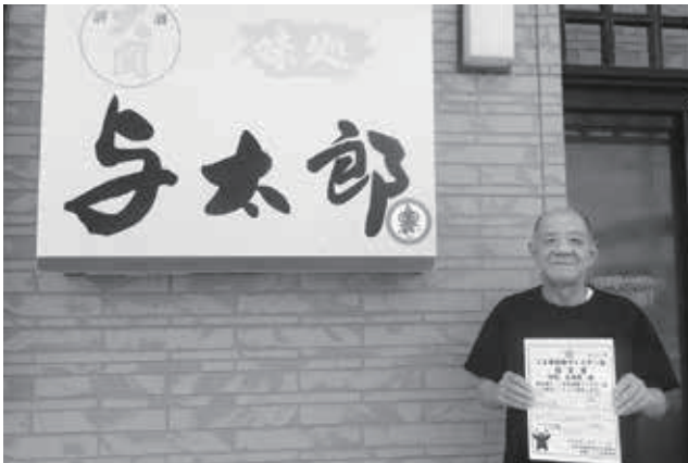
認定証を手にするスタッフのみなさん