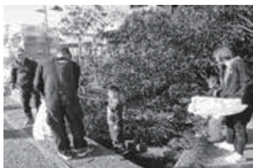
📷 クリーンウォークの様子