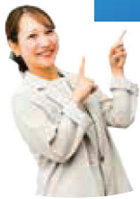
なり 種子島 奈里 編集長

「どぎゃんね?長洲町」では町の日常や風景、イベント情報など長洲町の魅力を発信中です。皆さんもインスタグラムの投稿に「#どぎゃんね?長洲町」を付けてぜひ発信してみてください！