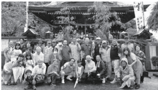
茅の輪が完成し、晴れやかな表情の皆さん