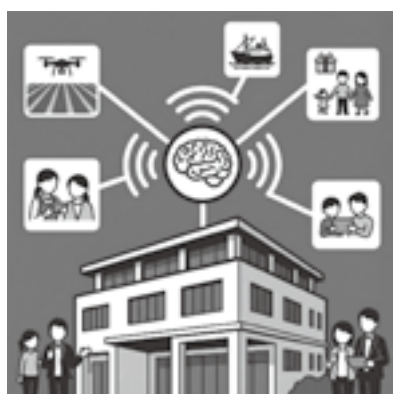
生成AIで長洲町をアップデート

本 町は「ながすアプリ」や校務支援システム等ICT基盤が整っている。この基盤を活かし、生成AIを導入することで職員を定型業務から解放し、住民と向き合う時間を創出すべきだ。現状の課題と、生成AIによるまちづくりの考えは。