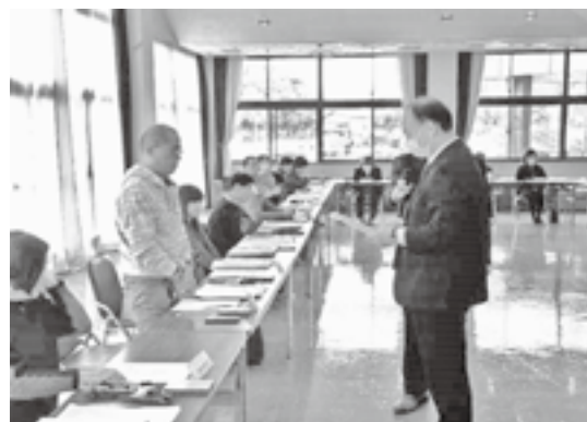
民生委員・児童委員委嘱状交付式 (町ホームページより)

答 (福祉保健介護課長) 無報酬のボランティアでの活 動であり、県からは活動費の名目 で一人当たり年間6万2千円、町 からは民生委員・児童委員協議会 補助金として269万9千円を交 付している。協議会の中の各種 研修会や、1人当たり年間 4万8千円の活動費を含む内容と なっている。