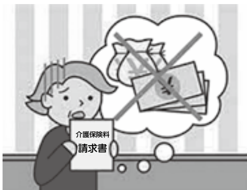
急がれる介護保険料の引き下げ

一生にわたって介護保険料を支払っているにも関わらず、介護保険サービスを利用していない、給付を受けていない被保険者は約85%にも上る。高齢者の生活は本当に厳しい。介護保険料の引き下げは今まで支払ってきた介護保険料の一部を該当する対象者に還元することになり、住民が納得する一定額の引き下げを念頭に実施してもらいたい。介護保険運営協議会に向けて、どの程度までなら引き下げが可能なのか入念に試算を行い提案が必要だ。