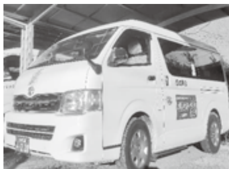
安全は全てにおいて優先する。 日頃よりの安全運転に感謝！

一部の町外登録利用者が、玉名駅から長洲港まで当タクシーを使い、フェリーで島原市へ渡航する等の利用をしていることについて、当事業の本来の目的との乖離、また、民業の圧迫を懸念している声があるが。