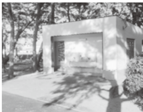
和式トイレの使い方がわからない子どもも多い

総 合スポーツセンターの具体的な施設の老朽化の現状と今後の維持管理、更新に関する長期的な計画は。