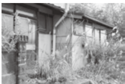
さらなる空き家対策が必要

答 ホームページや広報誌、固定資産税の納税通知書に空き家対策のチラシ等を同封している。