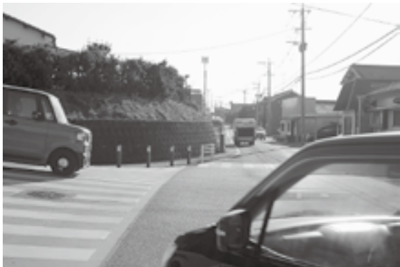
交通が多い丁字路交差点

問 野区のマルエイ六栄店東の丁字路交差点は、車等の交通量が多く、道幅が狭い所があるため、通学中の小中学生は非常に危険である。この状態を改善する必要があるのでは。 答 (町長) これまで当該箇所の安全対策を実施し、交差点の安全確保に取り組んでいる。対策工事後は、交通事故は発生していない。 問 今すぐに道路の幅を広げる工事の予定はないか。