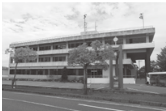
人口減少時代に立ち向かえ

定 住に向けた取組について、本町の人口は年々減少し、令和7年10月31日現在において、1万5097人となっている。レインボーみやの」の入居状況と、その世帯の属性は。