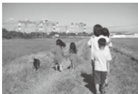
子どもたちの未来を守ろう