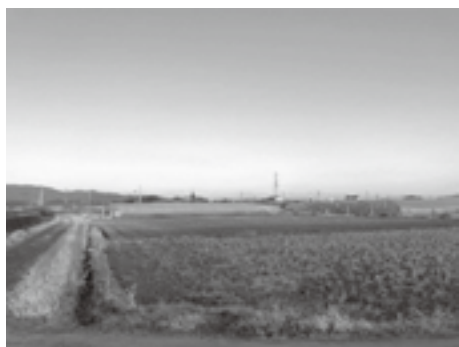
農業振興は喫緊の課題