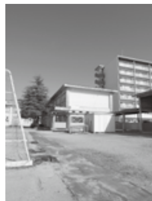
六栄小学校東校舎