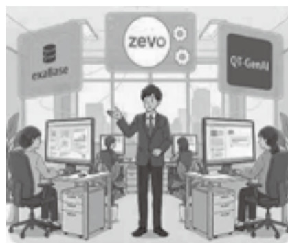
三つの最新AIを検証中

答 (まちづくり課長) 有明圏域の市町と連携し、共同導入による利用料の割引等を検討している。現在、圏域内の未導入自治体と足並みをそろえ、具体的なコスト削減案を協議中である。