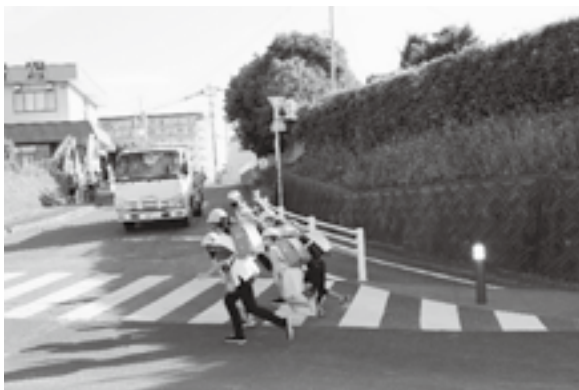
安全が課題である通学路

答 (建設課長) 宮野橋付近から向野踏切に向かう通りの約250メートルは、道路拡幅に向けた詳細設計を実施している。現在、道路の幅員が約5メートルなので、歩道を含めて整備を考えている。 問 歩道を含めた道路幅は何メートルになるか。 答 (建設課長) まだ、拡幅に向けた内容は確定していない。 問 改良工事完成までの期間は。