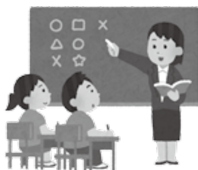
教育環境の充実に向けて