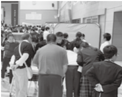
避難者の受付け訓練〈長洲中体育館〉