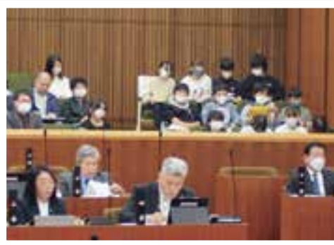
傍聴席での見学の様子

六栄小学校6年生が、授業の一環として議会見学に来てくれました。議会事務局の説明の後、議場では私語もなく興味津々に傍聴している様子は、町の将来の担い手として、とても頼もしく見えました。後日、「もっと見たかった。」「身近なことを話し合ってたてビックリした。」「将来自分も議員になりたい。」等、多数の感想をいただきました。ごく一部ではありますが紹介します。