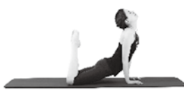
ヨガストレッチマット