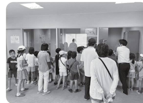
8月3日:クリーンパークファイブを見学

8月2、3日の2日間、町内の小学1年生から3年生を対象に「子どもミニデイサービス」を行いました。