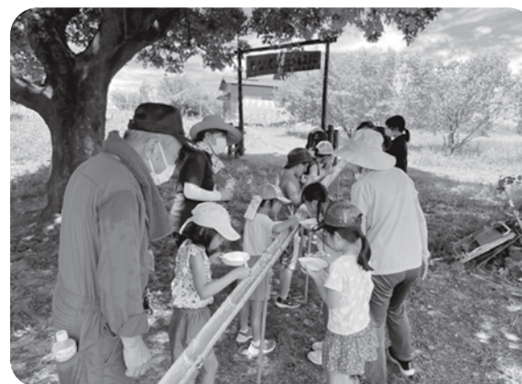
8月2日:ボーイスカウトとの交流(流しそうめん)